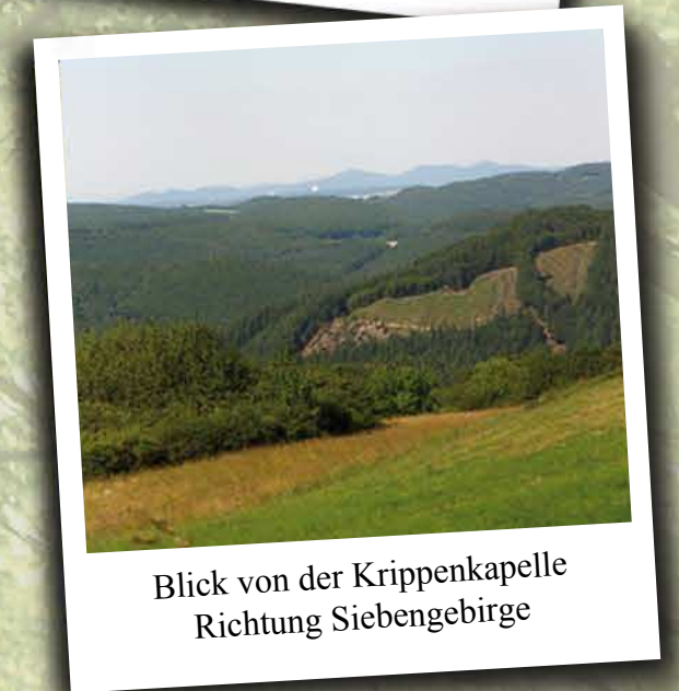
Blick von der Krippenkapelle Richtung Siebengebirge