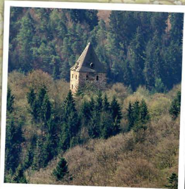
Wensburg bei Obliers

Routenbeschreibung: Von der Wandertafel an der Kapelle folgen Sie den Wegweisschildern mit der „Burg“. Es ist ein Rundwanderweg mit dem Thema „Die Ortsgemeinde im Wandel der Zeit“. Er führt oberhalb von Obliers in Richtung Burgruine Wensburg. Sie kommen zu einer Wandertafel und dort haben Sie die Möglichkeit, ca. 900 m bergauf zur Burgruine Wensburg zu wandern. Von der Wandertafel aus gehen Sie über eine Brücke, die über den Liersbach führt und überqueren dann die K 28. Nun wandern Sie Richtung Wochenendgebiet. Auf dieser Wegstrecke haben Sie einen schönen Blick auf die Burgruine Wensburg. Jetzt geht es weiter zur Marienkapelle und von dort zurück zum Ausgangspunkt. Auf dem Wanderweg können Sie sich auf drei Hinweistafeln zum Thema „Ortsgemeinde im Wandel der Zeit“ informieren.